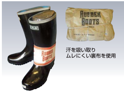
汗を吸い取り ムレにくい裏布を使用

普通の長靴と、膝下まであり、縛れるタイプがあります。 さらにつま先に鉄板が入った安全長靴もあります。