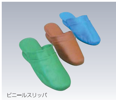
ビニールスリッパ