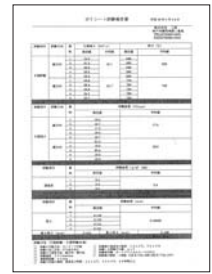
ポリシート試験報告書