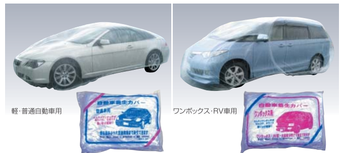
軽・普通自動車用